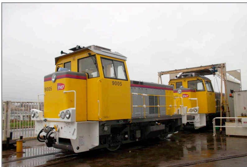
Les Y 9005 et 9003 chez SOCOFER, en attente de livraison.

Les Y 9000 sont destinés à l'activité Infra de la S.N.C.F. et reçoivent la livrée jaune de celle-ci. A l'origine le projet concernait plutôt le fret mais la baisse d'activité drastique dans ce domaine a entraîné cette réorientation.