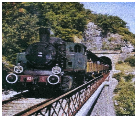
Le train du HAUT- QUERCY