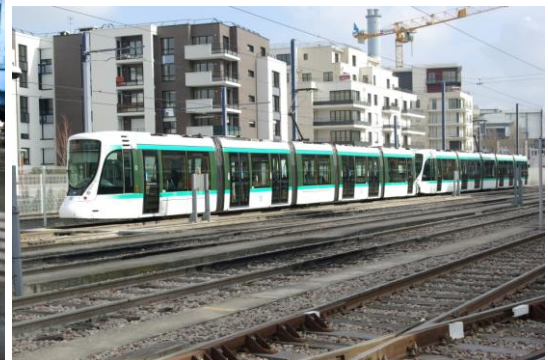
Un élément double sur une voie du dépôt