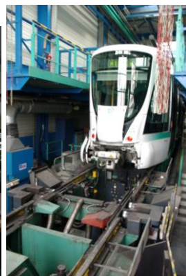
Le tour en fosse