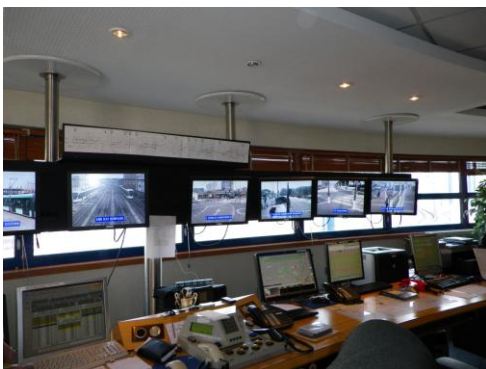
Le poste de surveillance et de régulation

Voici quelques images du dépôt atelier du T2 de la RATP que nous avons pu visiter préalablement à l'assemblée générale du 13 mars 2010. A noter que cette ligne est exploitée avec du matériel CITADIS de 2,40m.