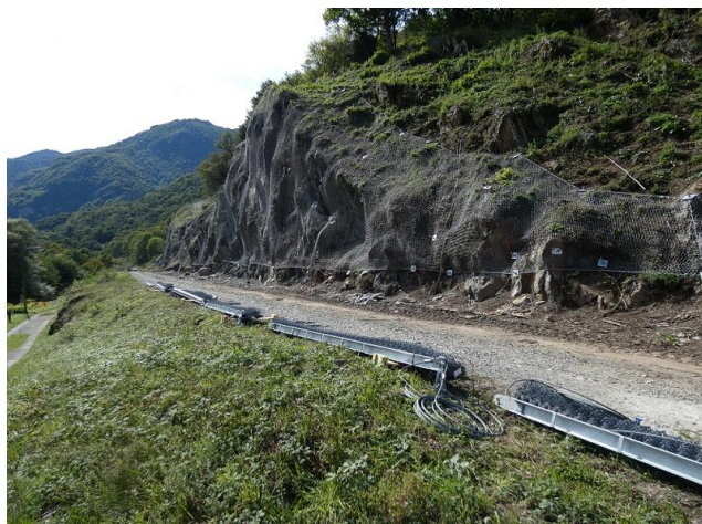
Etat des travaux gare de Luchon et en ligne