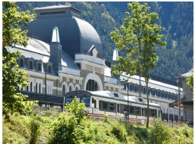
Souvenir d'un train spécial sur la ligne de Canfranc.