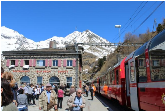
Arrêt en gare de d'Alp Grüm