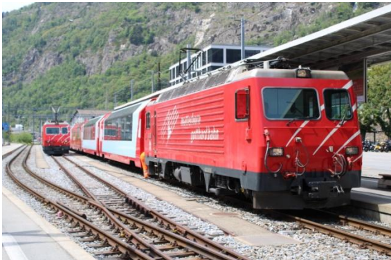
En gare de Brigue MGB