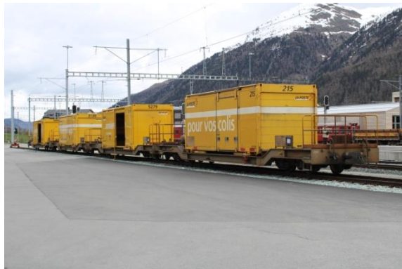
Quelques photos faites en gare de Samedan