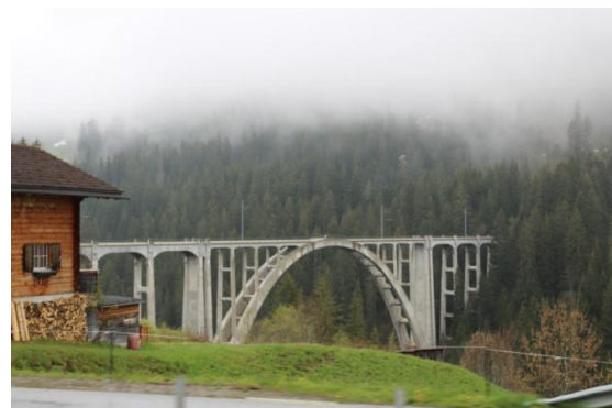
Le viaduc de Langwies