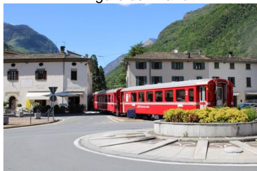
Passage derrière le chevet de la basilique de Tirano