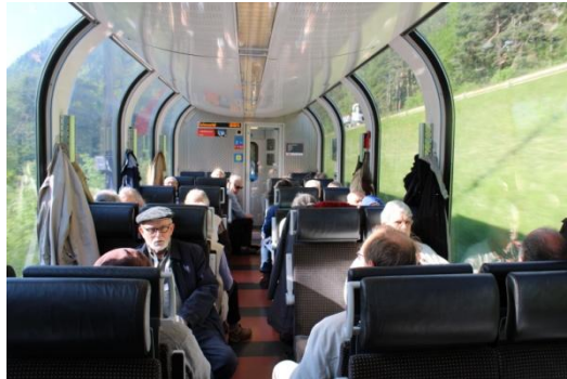
Le groupe à bord de la voiture panoramique

Le groupe a effectué un aller-retour jusqu'à Tirano en passant par le col de la Bernina. Le trajet aller a été effectué dans une voiture panoramique.