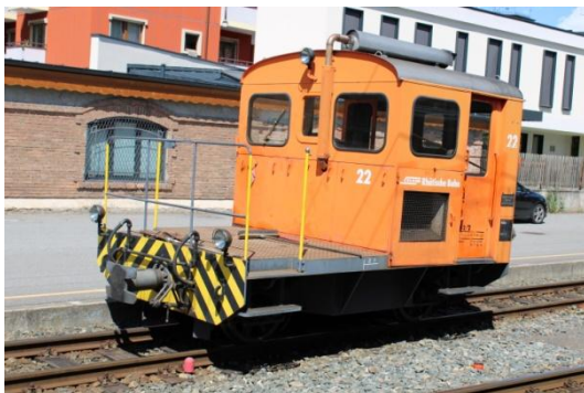
En gare de Tirano