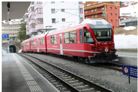
Manceuvre en gare d'Arosa