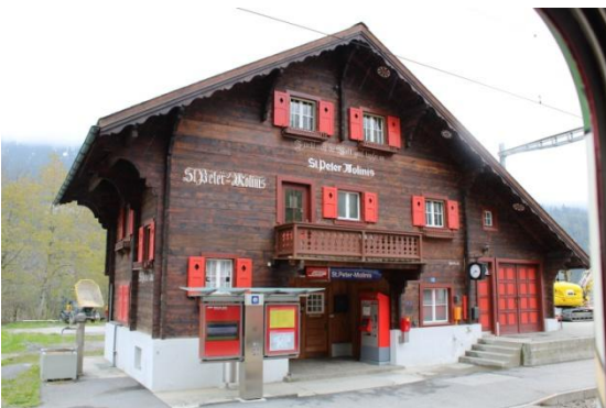
La gare de St Peter Pagig