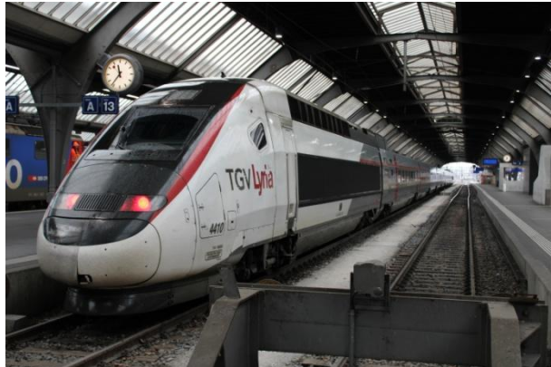
Le TGV Lyria qui a conduit le groupe jusqu'à Zurich

Le groupe a quitté la gare de Paris-Gare de Lyon pour Zurich.