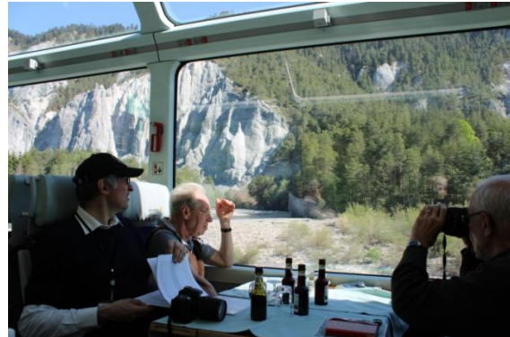
La table est dressée pour le repas