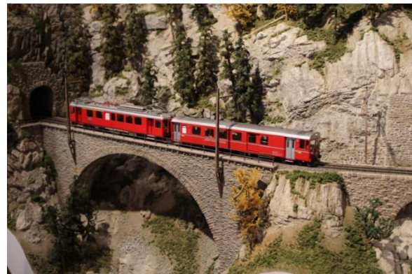
Au musée ferroviaire de Bergün